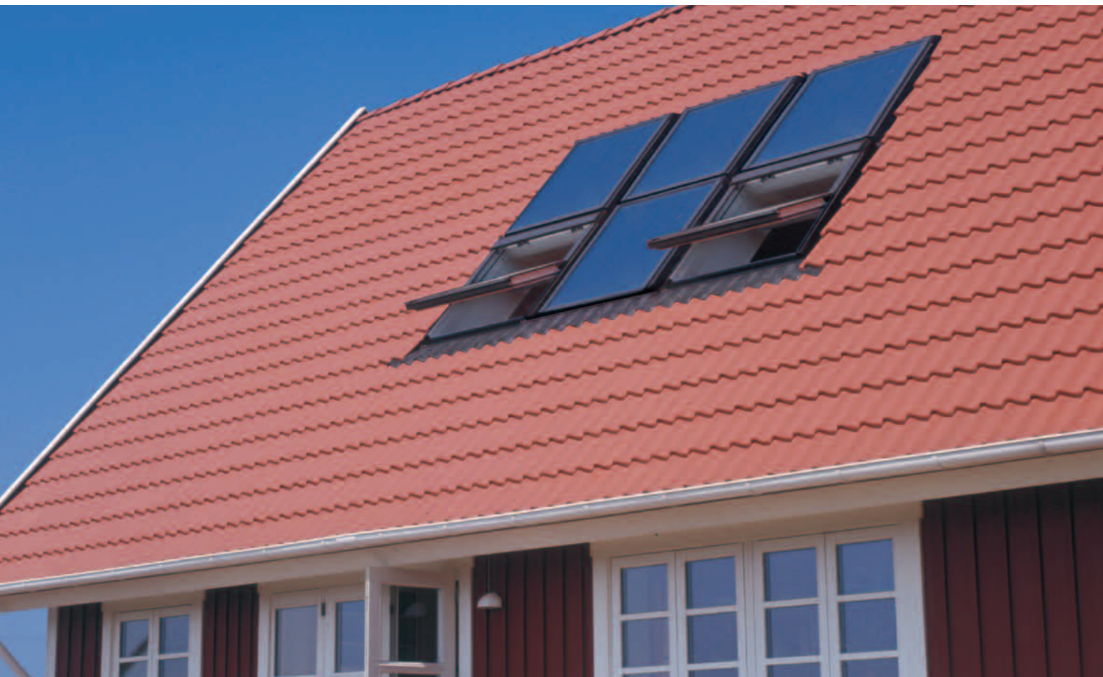
Solfangeranlegget skal dimensjoneres etter familiens varmtvannsbehov. Se VELUX solfangerpakker i prislisten.