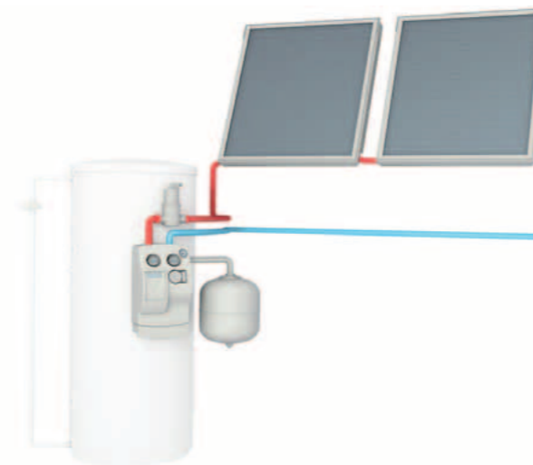
Tank leveres ikke av VELUX